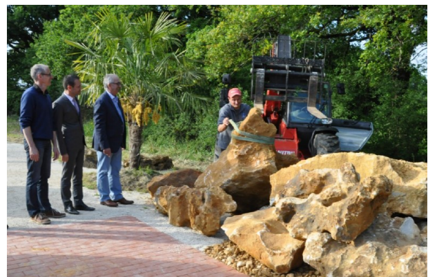
Pose de la dernière pierre