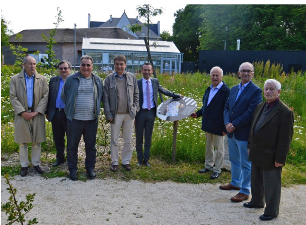
Les membres du conseil scientifique du Jardin des roches et Monsieur Frimaudeau